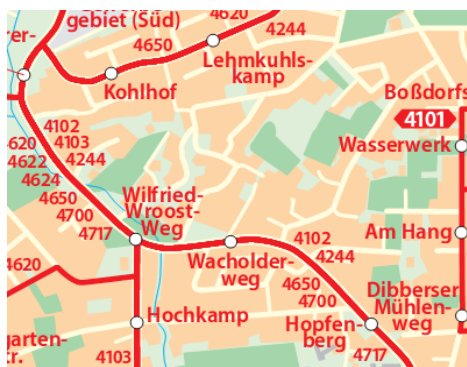
HVV Streckennetzplan Buchholz