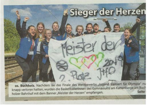
os. Buchholz. Nachdem sie das Finale des Wettbewerbs „Jugend trainiert für Olympia“ nur knapp verloren hatten, wurden die Basketballerinnen des Gymnasiums am Kattenberge am Buchholzer Bahnhof mit dem Banner „Meister der Herzen“ empfangen. Seite