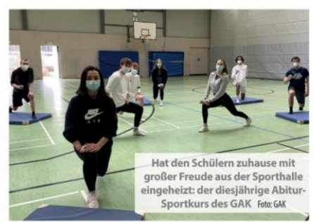
Hat den Schülern zuhause mit großer Freude aus der Sporthalle eingeeht: der diesjährige Abitur-Sportkurs des GAK

Im Buchholz. Das Gymnasium am Kattenberge in Buchholz sorgt dafür, dass die Schüler im Lockdown nicht zu Faulpelzen werden. An jedem Schultag um 11.30 Uhr, wenn normalerweise die zweite große Pause eingeläutet wird, wird Sport getrieben. Dann können sich Schüler, die Lust haben, in einen geschützten Videochat auf der GAK-Plattform einloggen und mit einer täglich wechselnden Sportlehrkraft fünfzehn Minuten Workout machen. Jeden Freitag gibt es dabei Unterstützung vom Sportabiturkurs des 13. Jahrgangs, der derzeit Präsenzunterricht hat und direkt