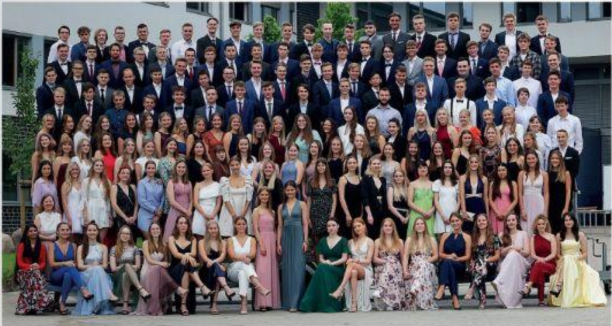
Große Gruppe: 166 Schülerinnen und Schüler bestanden ihr Abitur Am Gymnasium am Kattenberge

Gymnasium Am Kattenberge: Abiturientinnen und Abiturienten erreichen Durchschnittsnote von 2,11