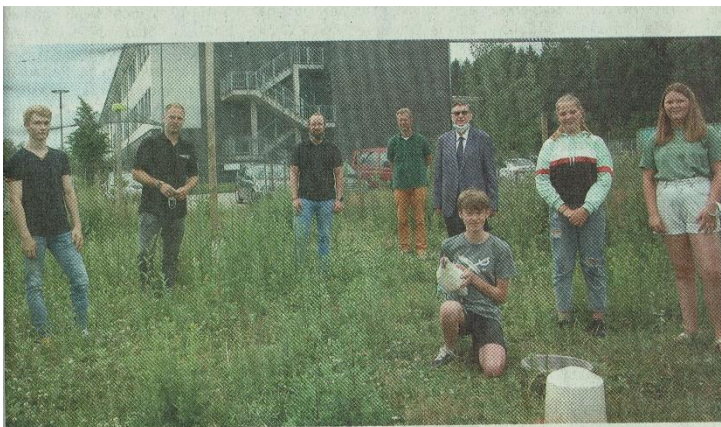
Arbeiten weiter gut zusammen: Schülerinnen, Schüler und Lehrer des Gymnasiums Am Kattenberge und Vertreter des Kiebitzmarktes