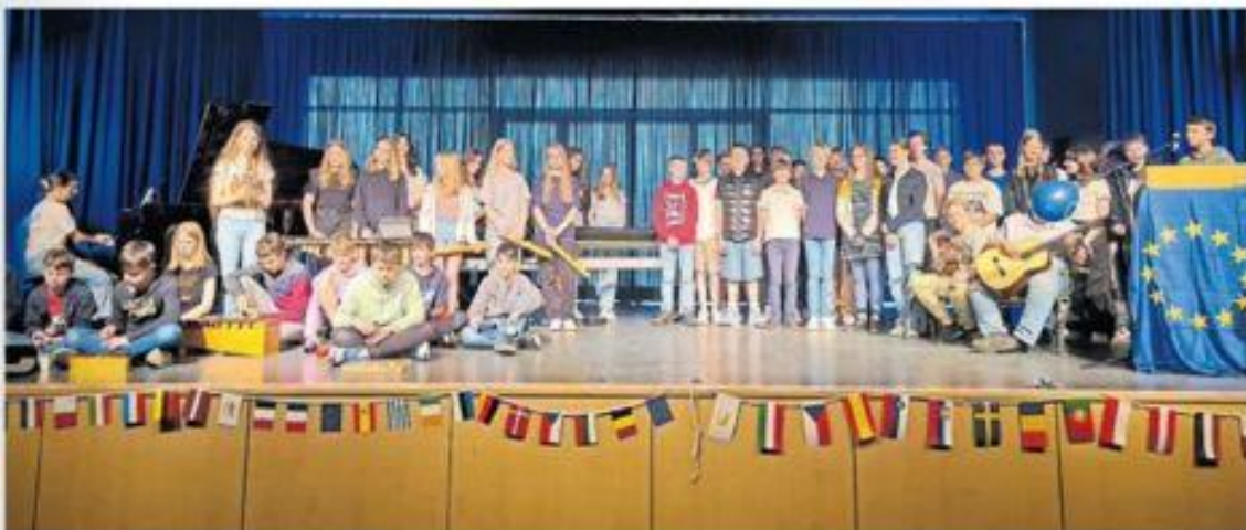
Die Schülerinnen und Schüler eröffneten die Zeremonie mit einer musikalischen Darbietung