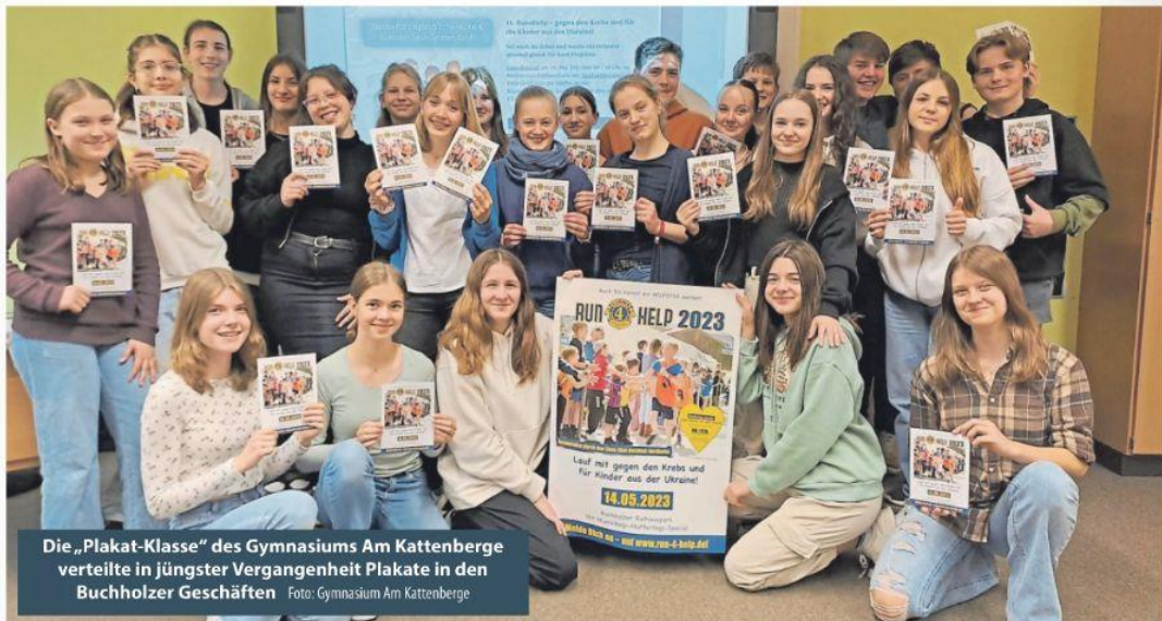
Die „Plakat-Klasse“ des Gymnasiums Am Kattenberge verteilte in jüngster Vergangenheit Plakate in den Buchholzer Geschäften.